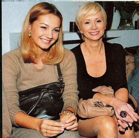
Aktorki Małgorzata Socha i Ewa Gawryluk wiedzą, że Klinika La Perla poza zabiegami chirurgicznymi ma do zaoferowania również SPA i wiele zabiegów relaksacyjnych.