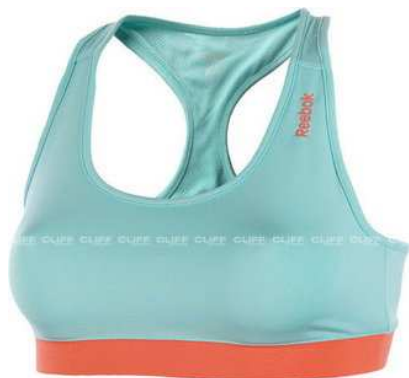
Reebok 89,00 zł