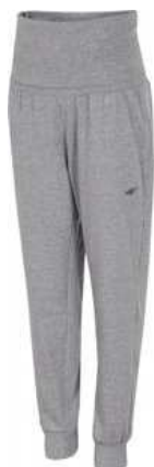
4F 79,90 zł