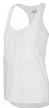
4F 34,90 zł